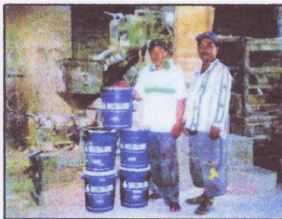
Gambar : Mesin penggiling padi yang menggunakan DELTALUBE 757 / 40

Kami mengucapkan terima kasih kepada PT. Timurraya Karya Mandiri dan Bapak Tjiptadi.